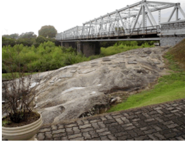
Piedra Alta en el departamento de Florida